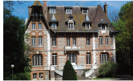
Angerville l'Orcher (Haute Normandie)