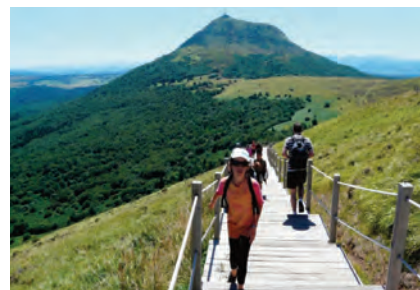
Saint-Ours les Roches (Auvergne)

éthic étapes Centre de rencontres internationales et de séjours